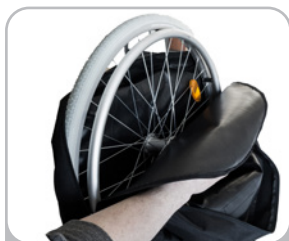
kod DW-11 pokrowiec na koła tyne