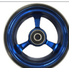
kod 2493 125x37mm felga aluminiowa niebieska