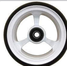
kod 2491 125x37mm felga aluminiowa biała