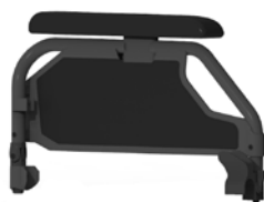
kod 107 z rurki, czarny, zabudowany, odchylany i wyjmowany, regulowany na wysokości głębokość podłokietnik, długość 330mm