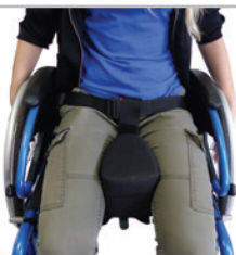
kod 5062 klin krokowy miękki