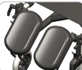
kod 52 podnóżek dla amputantów