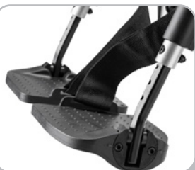
kod 946 dwa paski podudzia, dla każdej nogi oddzielnie