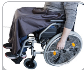
kod 5623 ocieplacz na nogi