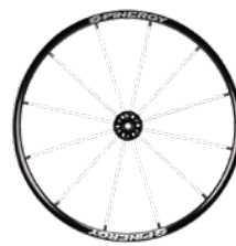
kod 2471 koła SPINERGY LX felga, piasta, szprychy białe