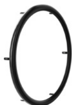
kod 853 ciąg GEKKO, owalne, aluminiowe, powlekane, ze zmienną warstwą gumową