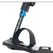
kod 822 paski przytrzymujące stopy (strzemiona)