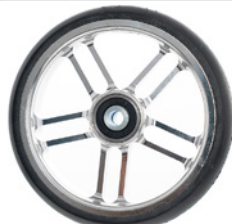
kod 2482 125x37mm felga aluminiowa srebrna