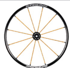
kod 2472 koła SPINERGY LX felga, piasta, szprychy pomarańczowe