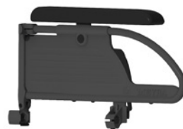
kod 21, 81, 84 z rurki, czarny, zabudowany, wzmocniony, odchylany i wyjmowany, regulowany na wysokość podłokietnika, długość 360, 260, 310 mm