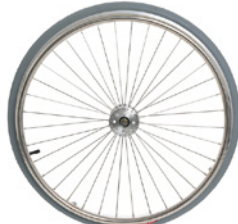
kod 848 koła SILVERDESIGN