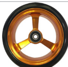
kod 2494 125x37mm felga aluminiowa pomarańczowa