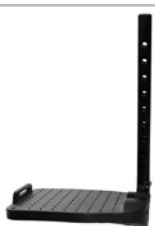
kod 798 dzielony, z tworzywa, regulacja wysokości i kąta, głębokość 160mm