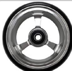
kod 2489 125x37mm felga aluminiowa srebrna