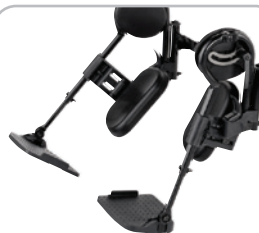
kod 92/2192 podnóżek z ręczną regulacją kąta do wyprostu