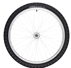
kod 2466 koła CROSS