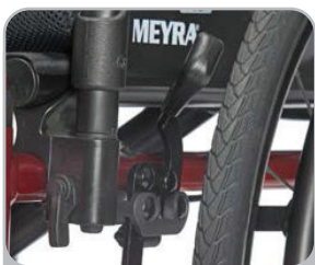
kod 305 hamulce dociskowe