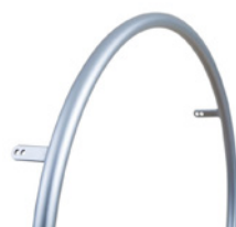
kod 494 aluminiowe, srebrne