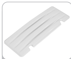
kod 936 deska do przesiadania