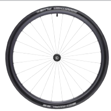
kod 2473 koła BLACKLIGHT