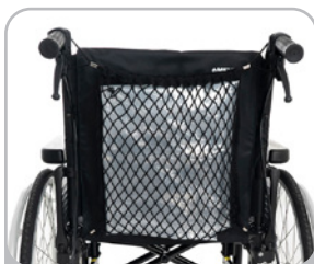
kod 951 siatka na zakupy