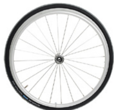
kod 752 koła LIGHT