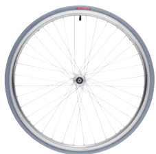
kod 651 koła standardowe