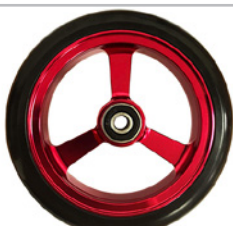
kod 2492 125x37mm felga aluminiowa czerwona