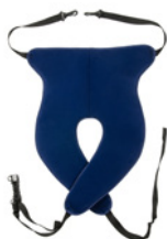
kod 4164/3274/4163 pasy odwodzące nogi