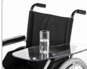
kod 4662/4663 z plexi, nasuwany jednostronnie