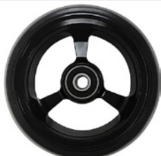
kod 2484 100x37mm felga aluminiowa czarna