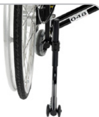
kod 728, 729, 730 kółka podporowe odchylane