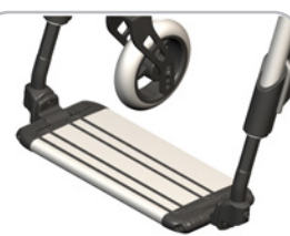
kod 54 jedenoczęściowy, aluminowyw kolorze ramy, regulacja wysokości, głębokości i kąta, głębokość płyty 150mm