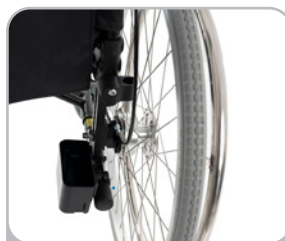
kod 970 uchwyt na kule