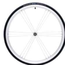
kod 2465 koła SIX-STAR