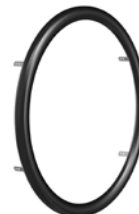
kod 850 ciągi CURVE L trapezowe, aluminium - powlekane