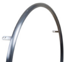
kod 493 ze stali polerowanej