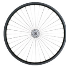
kod 695 koła AKTIV