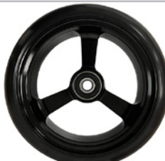
kod 2490 125x37mm felga aluminiowa czarna