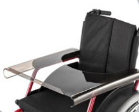
kod 930 z plexi, przednia krawędź podwyższona