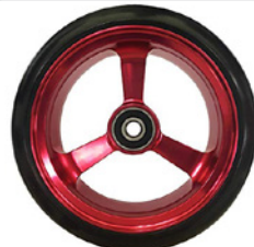
kod 2486 100x37mm felga aluminiowa czerwona