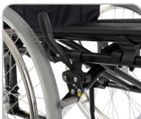
kod 681 przedłużona dźwignia, składana