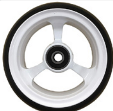
kod 2485 100x37mm felga aluminiowa biała