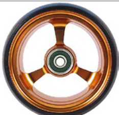
kod 2488 100x37mm felga aluminiowa pomarańczowa