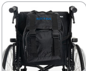
kod 962 plecak jednokomorowy