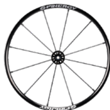
kod 2470 koła SPINERGY LX felga, piasta, szprychy czarne