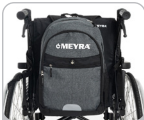
kod 261519300 plecak wielokomorowy