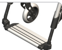
kod 87 jedenoczęściowy, aluminowyw kolorze ramy, regulacja wysokości, głębokości i kąta, głębokość płyty 100mm