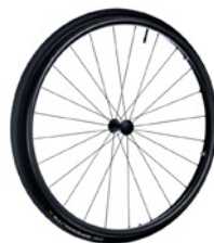
kod 2468 koła DAY LITE