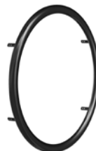
kod 849 ciągi CURVE L trapezowe, aluminium - anodowane