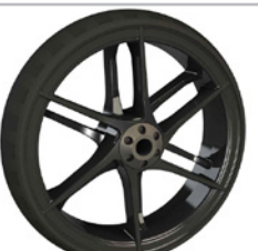
kod 2496 125x30mm felga karbonowa czarna