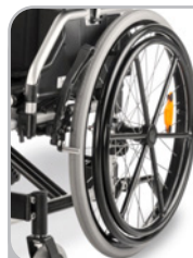
kod 871 system ciągów jednostronnych