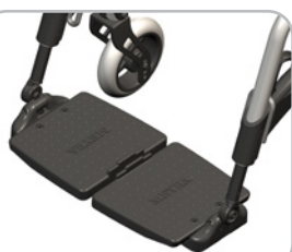
kod 808 dzielony, z tworzywa, regulacja wysokości i kąta, głębokość 150mm