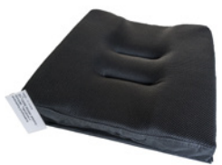
kod 10219 poduszka siedziska delika- nie profilowana