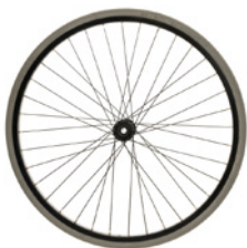
kod 2651 koła standardowe