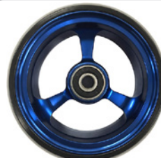
kod 2487 100x37mm felga aluminiowa niebieska