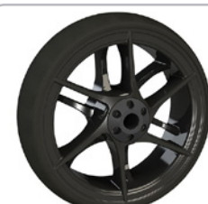
kod 2495 100x30mm felga karbonowa czarna