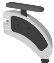
kod 748 aktywny, aluminiowy, czarny, z izolacyjną wkładką kar- bonową, stały, nadkole ok. 50mm regulowany skokowo na wysokość podłokietnik