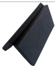
kod 9868 poduszka siedziska, składana