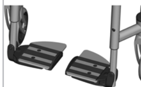
kod 805 dzielony, aluminiowy, czarny, regulacja wysokości, głębokości i kąta, głębokość płyty 150mm