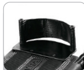
kod 823 zapiętki