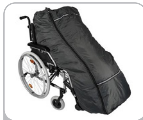
kod 3075902 śpiwór dla użytkownika o wzroście 160-185 cm