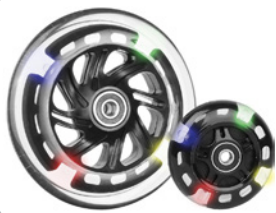
kod 2480 100x23mm, świecące, felga z tworzywa