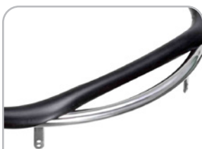
kod 166 silikonowe nakładki na ciągi, czarne