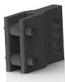
kod 880 przesunięcie montażu kół tylnych o 60mm do tyłu wózka (poza ramę wózka)