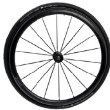
kod 2469 koła SPINERGY CLX, wykonane z carbonu