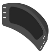
kod 100, 98 aktywny, aluminiowy, czarny, z izolacyjną wkładką karbonową, stały, nadkole ok. 35 mm, 50 mm