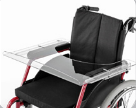
kod 929 uniwersalny, z plexi, nasuwa- ny na podłokietniki